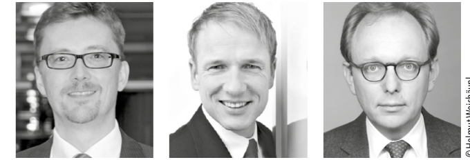
Die Herausgeber des neuen Praxiskommentars

»Der Auernhammer« gliedert sich übersichtlich in drei Teile: In die Kommentierung der neuen Datenschutz-Grundverordnung DSGVO, in das bisher geltende Bundesdatenschutzgesetz inkl. Ausblick, wo sich künftig welche Regelung in der DSGVO wiederfinden wird, und in die sogenannten Nebengesetze wie das Telemediengesetz und das Telekommunikationsgesetz. Darüber hinaus gibt der Titel eine Einführung in die EU-Datenschutzrichtlinie für Polizei und Justiz. Anfang 2018 erscheint ergänzend digital die Vollkommentierung des neuen BDSG, das die DSGVO mit nationalen Sondervorschriften ergänzt. Sie wird zunächst Bestandteil der Onlineausgabe des